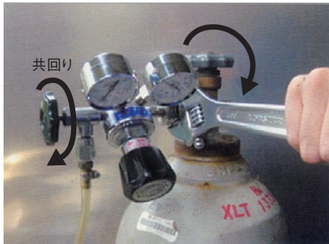
ネジレン未使用時